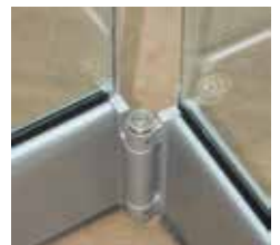
Μεντεσές βαρέως τύπου