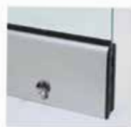
Μηχανισμός κλειδώματος με μισό κύλινδρο και πόμολο