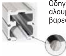
Οδηγός αλουμινίου βαρέως τύπου