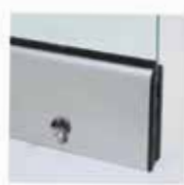
Μηχανισμός κλειδώματος με μισό κύλινδρο και πόμολο