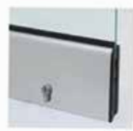
Μηχανισμός κλειδώματος με κύλινδρο