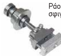
Ράουλο με σφαιγκτήρα inox